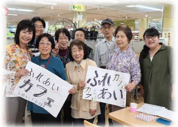
いつも楽しいカフェボランティアの組合員さん