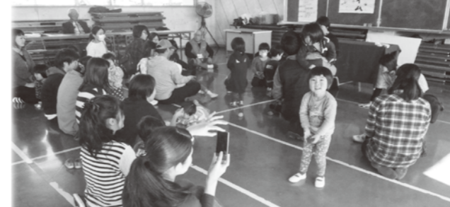
白川親子きらきらタイムの様子(白川公民館)