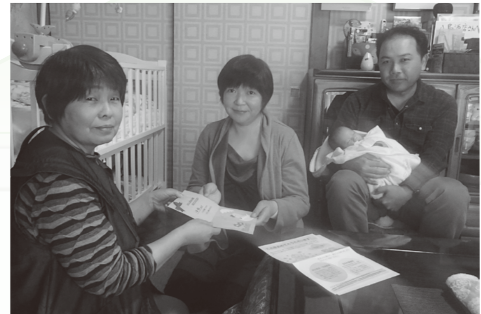
「手作りの温かいお誕生日カードありがとうございました」と喜んでいただきました。

市内16人の主任児童委員が作成し、今年度4月1日より市役所健康推進課保健師により配布している、「あかちゃんカード」が好評いただいております。