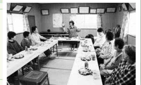
▲小原きつでの老舗サロン「みどりの会」は緑に囲まれた小さな集会所で開催。「ここの話はここの話で・・・」が合言葉。笑い声の絶えないサロンです。

地域に、何気ないささえあいや集いの場はありますか?皆さんの活動や取り組みについて私達におしえて下さい!