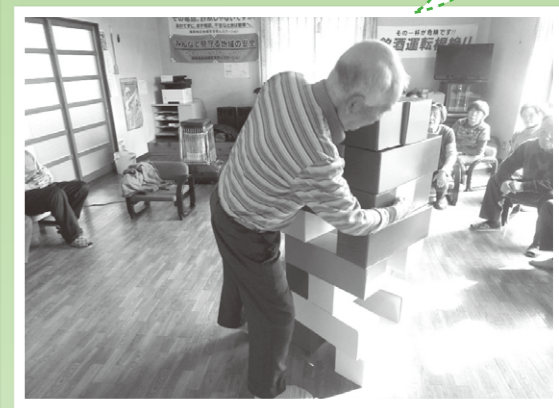
▲大型バランスゲーム