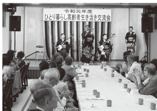
津軽三味線の演奏

市内のひとり暮らし高齢者に語らいと憩いの場を提供して、お互いの親睦を深めるとともに、楽しいひと時を過ごすことを目的に、年に一度交流会を開催しております。