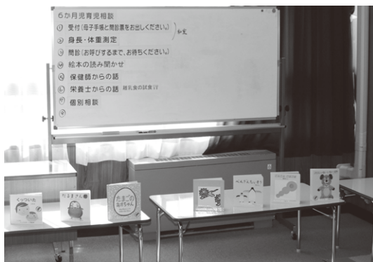
プレゼントの「絵本」