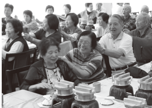
みんなで生き生き体操