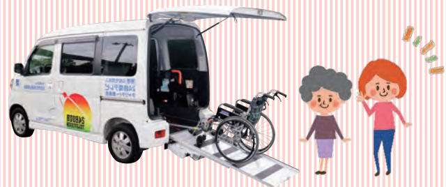
車イス用自動車貸出事業