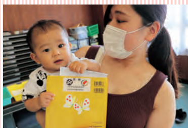
ブックスタート事業