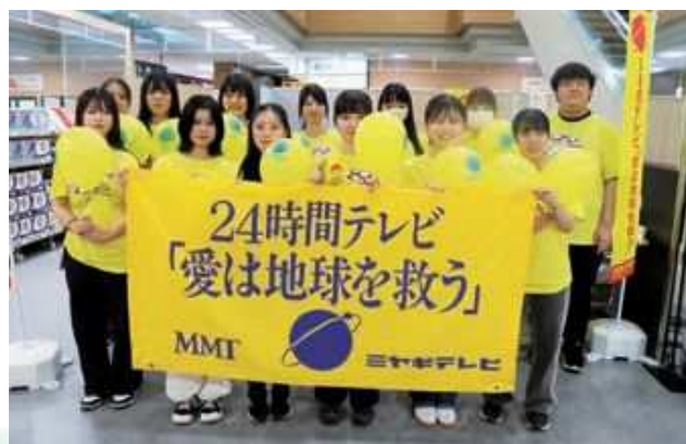
13名のボランティア