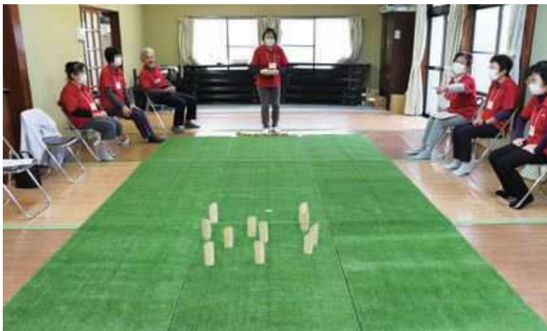
50点ピッタリを目指すぞ！