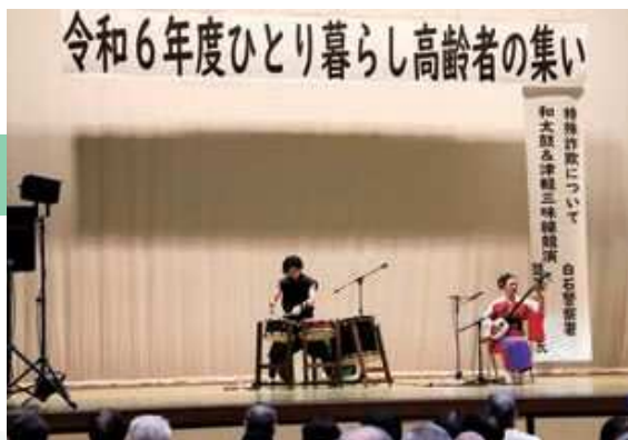
鼓風☆響のお二人による演奏

10月11日（金）70歳以上の方を対象に「令和6年度ひとり暮らし高齢者の集い」を開催し、特殊詐欺についての講話や和太鼓と三味線・日本舞踊のコラボを楽しんでいただきました。参加者は81名でした。