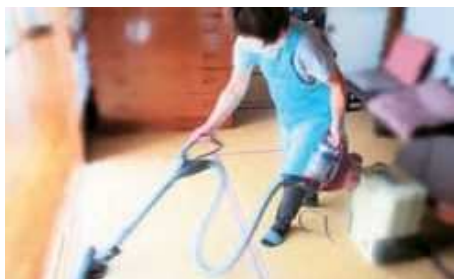
ゴミ出しやお掃除のお手伝いなど

利用会員が希望する内容と、協力会員(ボランティア)が活動できる内容を元に、担当者がマッチングを行います。昨今は協力会員不足のため、即座の対応ができない場合もあります。隙間時間を使ってボランティアしてみませんか？ お気軽にお問合せください。お待ちしております。