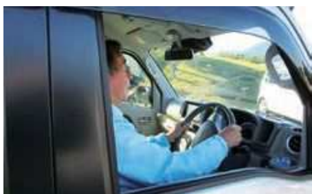
病院や買い物への移動支援