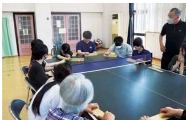
アイマスクでも体験