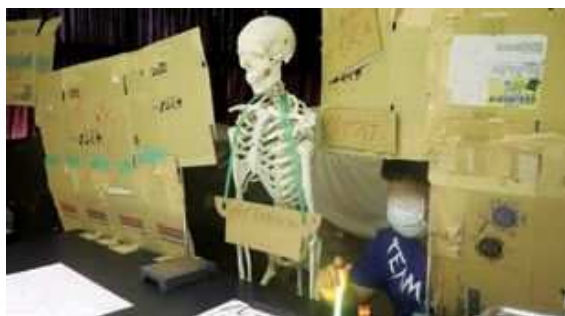
手作りのお化け屋敷で受付

小原小学校恒例の「みんなで遊ぼう会」は、児童たちでアイデアを出し合い、手作りで地域の住民さんに楽しんでもらうという、地域交流もできる素晴らしい学びです。